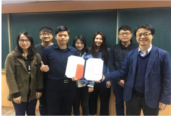
【台灣師範大學榮獲專題研究報告第一名】