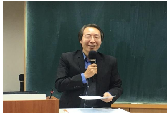
【台北大學涂登才教授講評】

本學分培訓課程已完成為期 15 週之多元專業實務主題，接續將與業者合作提供完成本學分課程學生實習機會，學生可了解職場實務現況並發揮所學，業者亦可遴選所需人才。未來本學分課程將研議擴大至中南部辦理，以培育更多校園菁英投入資產管理產業。