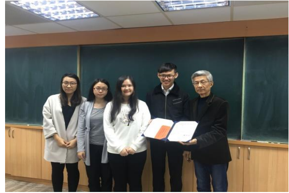
【銘傳大學榮獲模擬交易競賽第二名】