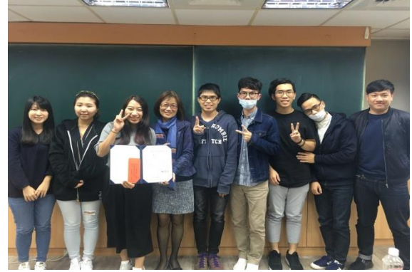
【東吳大學榮獲專題研究報告第二名】