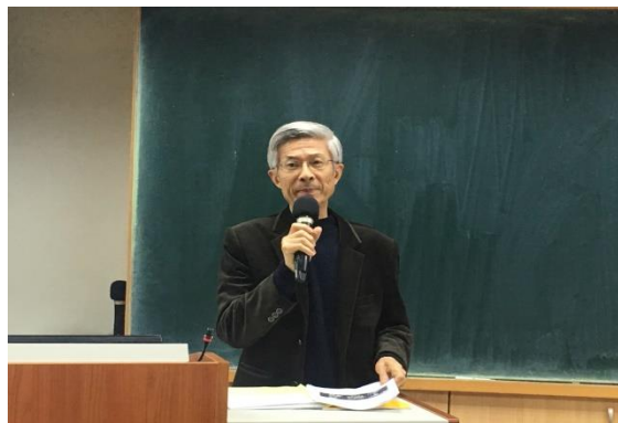
【銘傳大學李儀坤副教授講評】