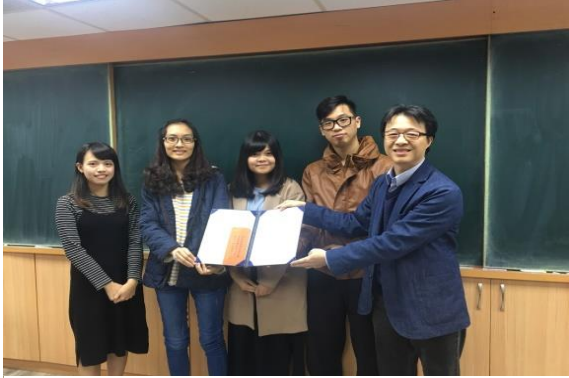
【台灣師範大學 榮獲模擬交易競賽第一名】