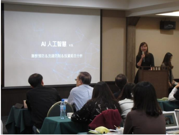
台北大學代表上台簡報之團隊