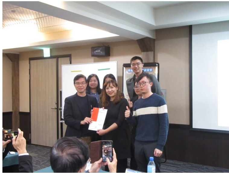
台北大學榮獲專題報告優勝，頒發獎學金及獎狀乙紙

本研習營可謂學期學分課程之延續，有助於學員們對資產管理產業實務的進一步深入認識，也為投入資產管理產業作前哨準備，裨益資產管理產業人才的培育。本次研習營辦理完成，參與本活動之學校對本研習營感咸以相當正面的評價，同時希望能持續辦理以延續學生實務學習。