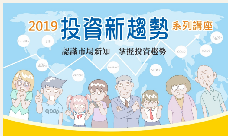
全民投資理財專題演講 (參加就抽獎的活動)