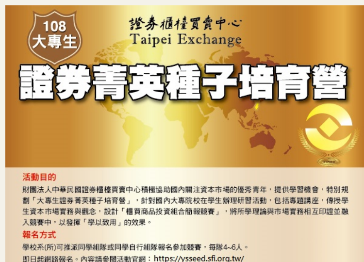
組隊做報告的投資組合競賽 (有獎金的大學生專屬活動)