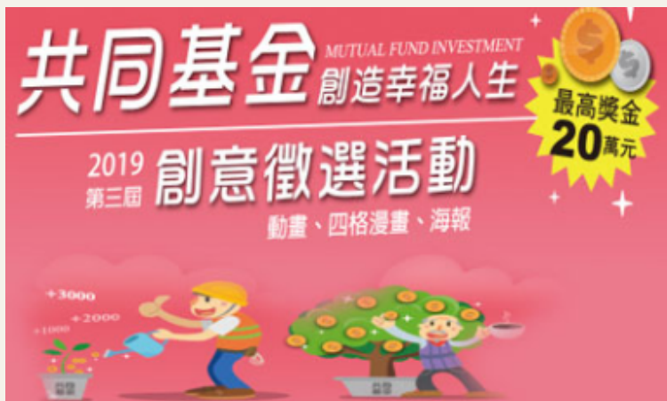
動畫、漫畫及海報創意徵選活動 (畫畫拿獎金的活動)