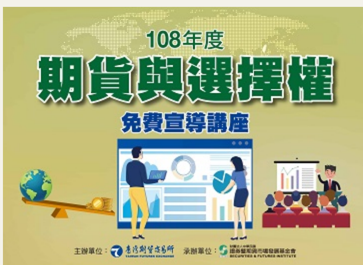
認識期貨市場的優質講座 (免費的活動)